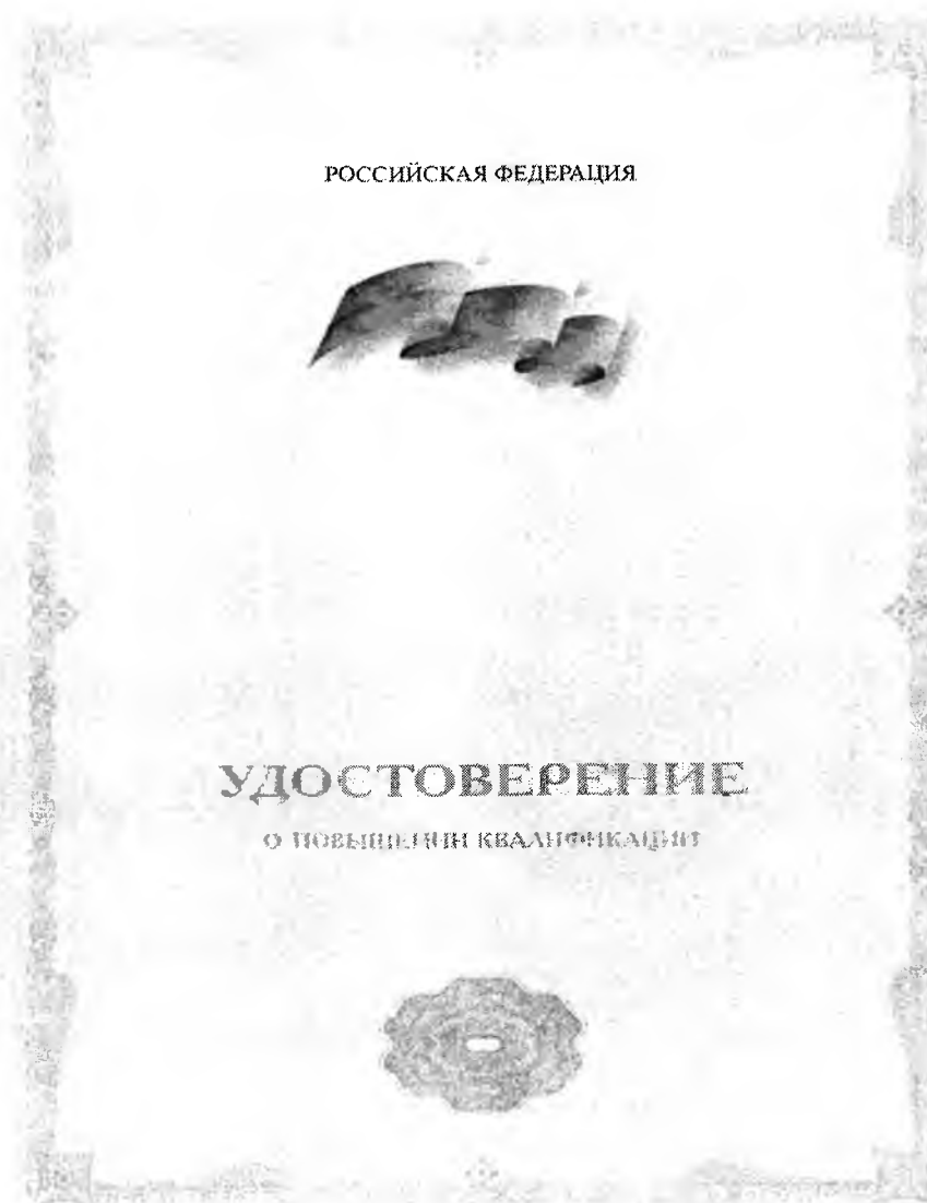
Рисунок 2- Применение стилизованного изображения Государственного флага Российской Федерации на бланке удостоверения о повышении квалификации