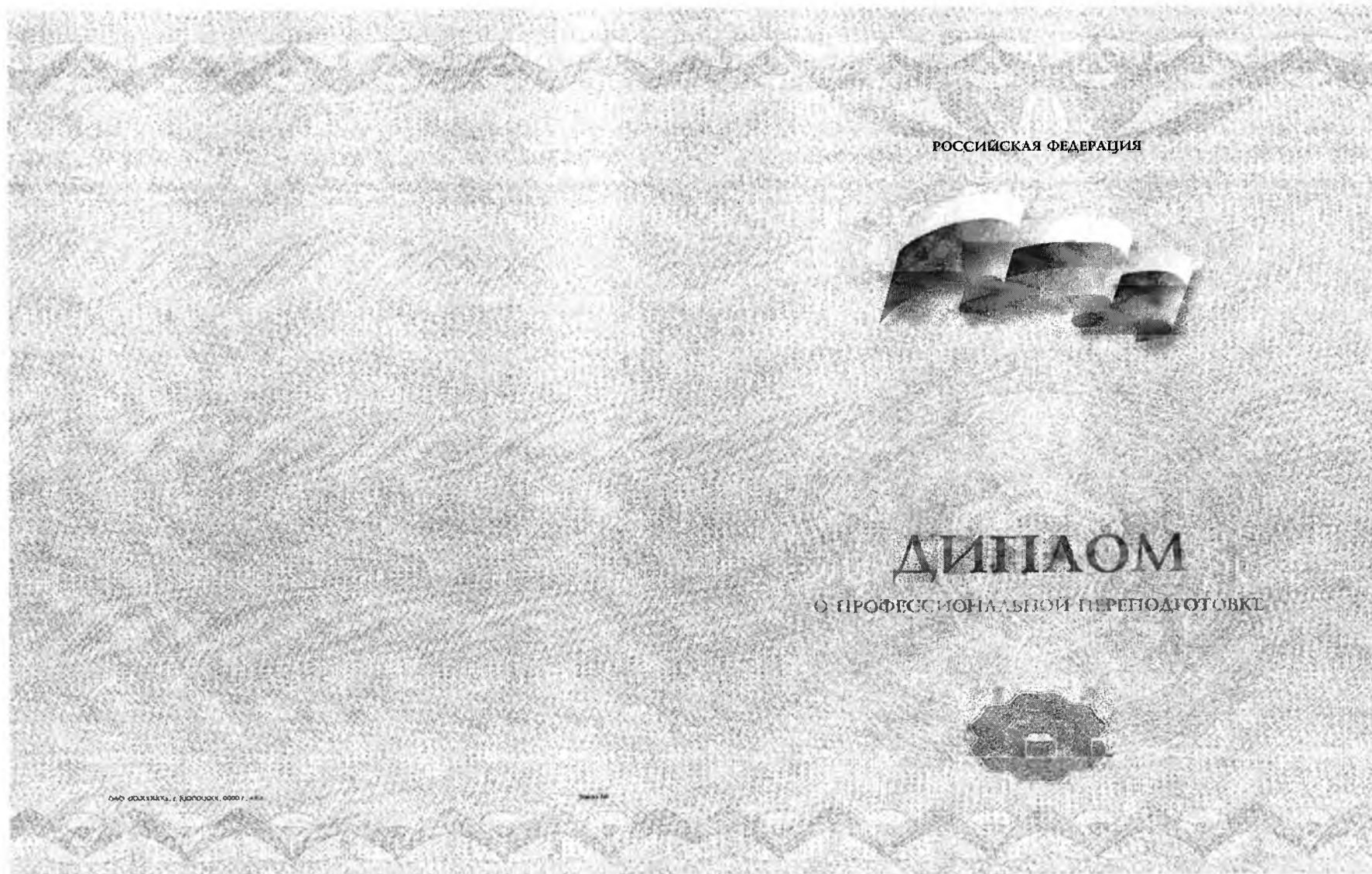
Рисунок 1- Применение стилизованного изображения Государственного флага Российской Федерации на бланке диплома о профессиональной переподготовке