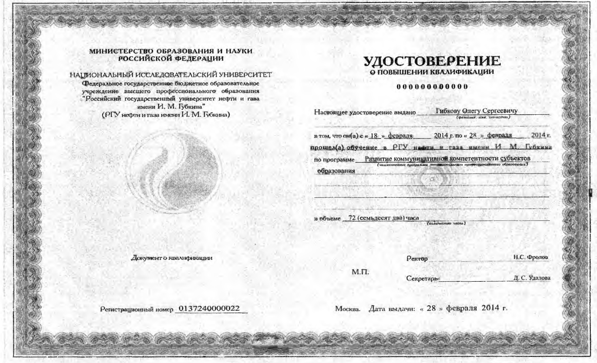
Рисунок 10 - Пример заполнения бланка удостоверения о повышении квалификации