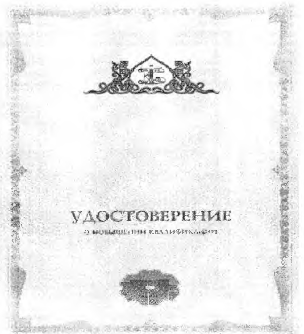
Рисунок 3 - Применение логотипа образовательной организации на бланке удостоверения о повышении квалификации