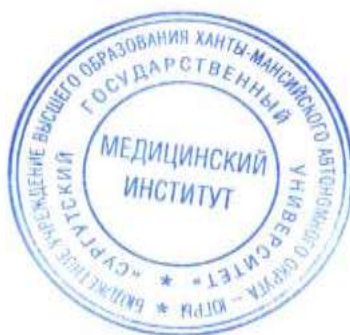
Рис. Оттиск печати

1.6. Институт имеет круглую печать со своим наименованием и указанием принадлежности к Университету (рис.), штамп (для справок), фирменные бланки.